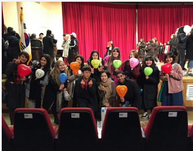
←終了式でダンパパフォーマンス をする先生を応援