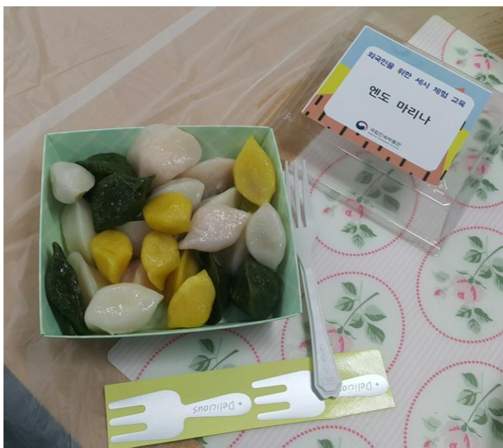
←完成したソンプジョン

った。今回は 4 種類の味のソンプジョンを作った。ソンプジョンを綺麗に作る事が出来ると、可愛い娘が産まれるという言い伝えがあり、綺麗に作れるように努めました。このイベントを通じて韓国の伝統的な秋夕の食べ物を食べる事が出来て良い体験をすることが出来た。