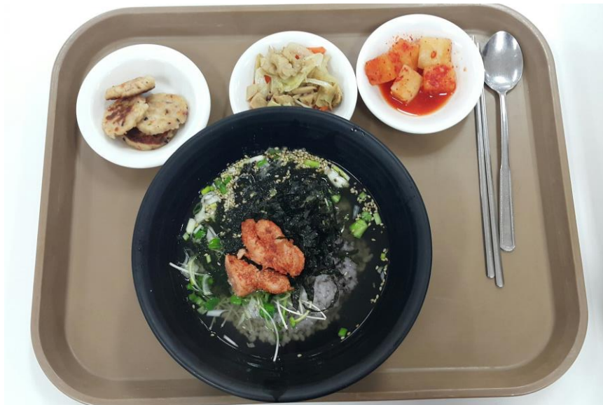
朝食 お茶漬け 2800ウォン

朝 8 時 30 分から 19 時までやっている。そのため 3 食学食という日もあった。値段も安く、お腹一杯になる。ご飯は大盛にしてくださいといえぱしてくれる。キムチ、たくわん、うどんの汁はセルフ。