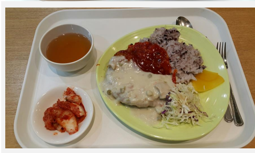
昼食 トンカツ 3800ウォン