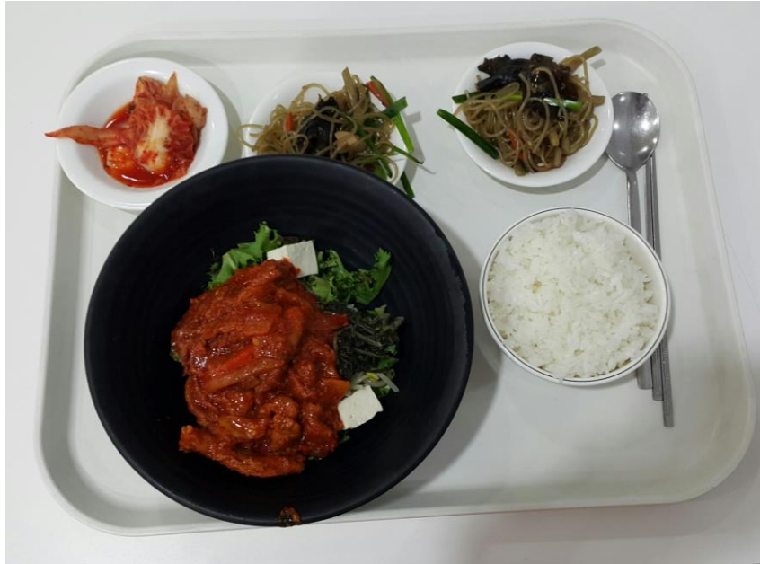
夕飯 ビビンバ 3500ウォン