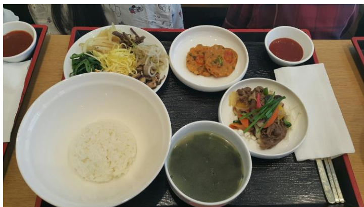
昼食に食べた韓食

韓服を着て景福宮へ行くと私たち以外にも韓服を着ている人が多い。観光客の方から写真を撮められたりした。たくさん写真を撮って、楽しんだ。